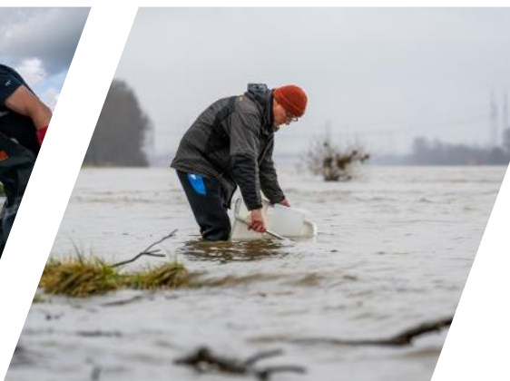
Elektrobefischung im Hafen Bad Honnef (links). Auswilderung von Glasaalen anlässlich des landesweiten Glasaalbesatz am Rhein in Leverkusen (rechts)