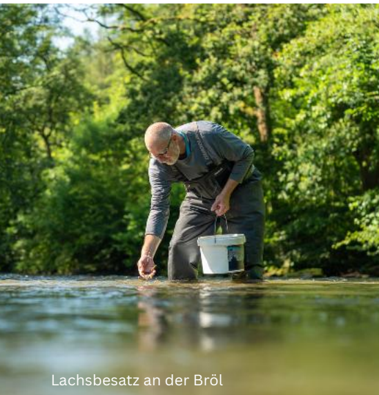
Lachsbesatz an der Bröl

(z. B: am Bodenkundeinstitut in Wien (BOKU) oder bei der Regionalkonferenz zum Lachsprojekt an der Bode ) sowie bei der Internationalen Rheinschutzkommission (IKSR). Daneben fanden öffentliche Führungen an der Kontrollstation Buisdorf und im Wildlachszenrum sowie das jährliche Lachsfest an der Sieg statt.