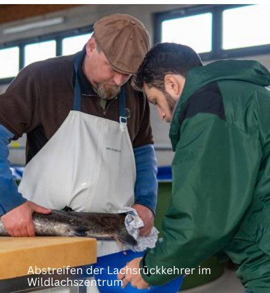
Abstreifen der Lachsrückkehrer im Wildlachszenrum