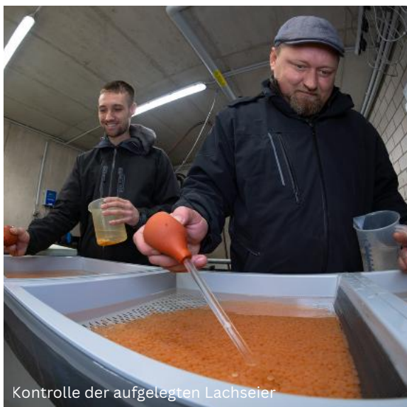
Kontrolle der aufgelegten Lachseier

Im Rahmen des Wanderfischprogramms konnte das RhFV Team in 2025 61 der in NRW insgesamt nachgewiesenen 80 Lachse und 18 der 36 in NRW registrierten Meerforellen in den Kontrollstationen im Siebgebiet erfassen. Im Wildlachszenrum wurden vom Team 512.000 Junglachse und 18.600 junge Meerforellen sowie rund 90.000 Augenpunkteier von Lachsrückkehrern produziert.